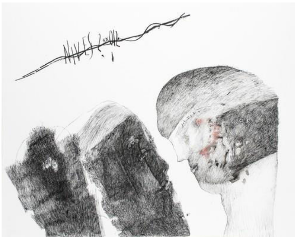
Pogled na sve uzaludne uzaludnosti, tuš perom, lavirani tuš kistom i akvarel na papiru, 62,7x78,5 cm, 2012.